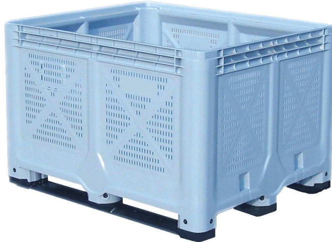
Palox 1200 x 1000 x 785, fond et parois ajourés, 3 semelles